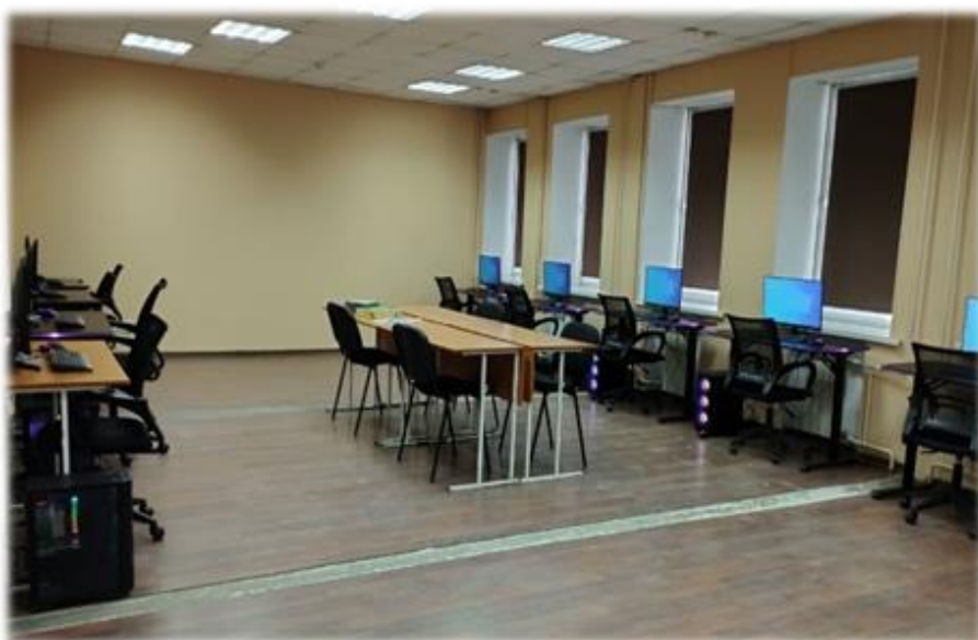
Площадка для проведения ДЭ по компетенции Коммерция