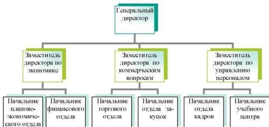
Рисунок 1 – Организационная структура ООО «СТК»

Иллюстрации должны иметь наименование, которое помещают по центру текста под иллюстрацией. Пример оформления иллюстрации приведен на рисунке 1. Содержание иллюстрации следует прокомментировать в тексте, выделяя закономерности и тенденции. Размещение иллюстрации в работе должно быть целесообразно и связано с предыдущим и последующим текстом письменной работы.