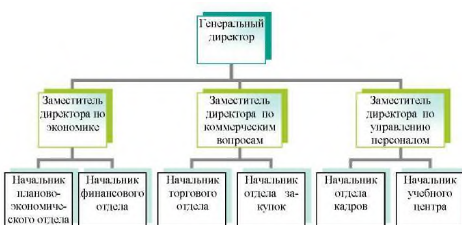
Рисунок 1 – Организационная структура ООО «СТК»

Содержание иллюстрации следует прокомментировать в тексте, выделяя закономерности и тенденции. Размещение иллюстрации в работе должно быть целесообразно и связано с предыдущим и последующим текстом письменной работы.