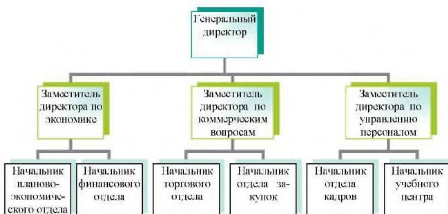
Рисунок 1 – Организационная структура ООО «СТК»

Содержание иллюстрации следует прокомментировать в тексте, выделяя закономерности и тенденции. Размещение иллюстрации в работе должно быть целесообразно и связано с предыдущим и последующим текстом письменной работы.